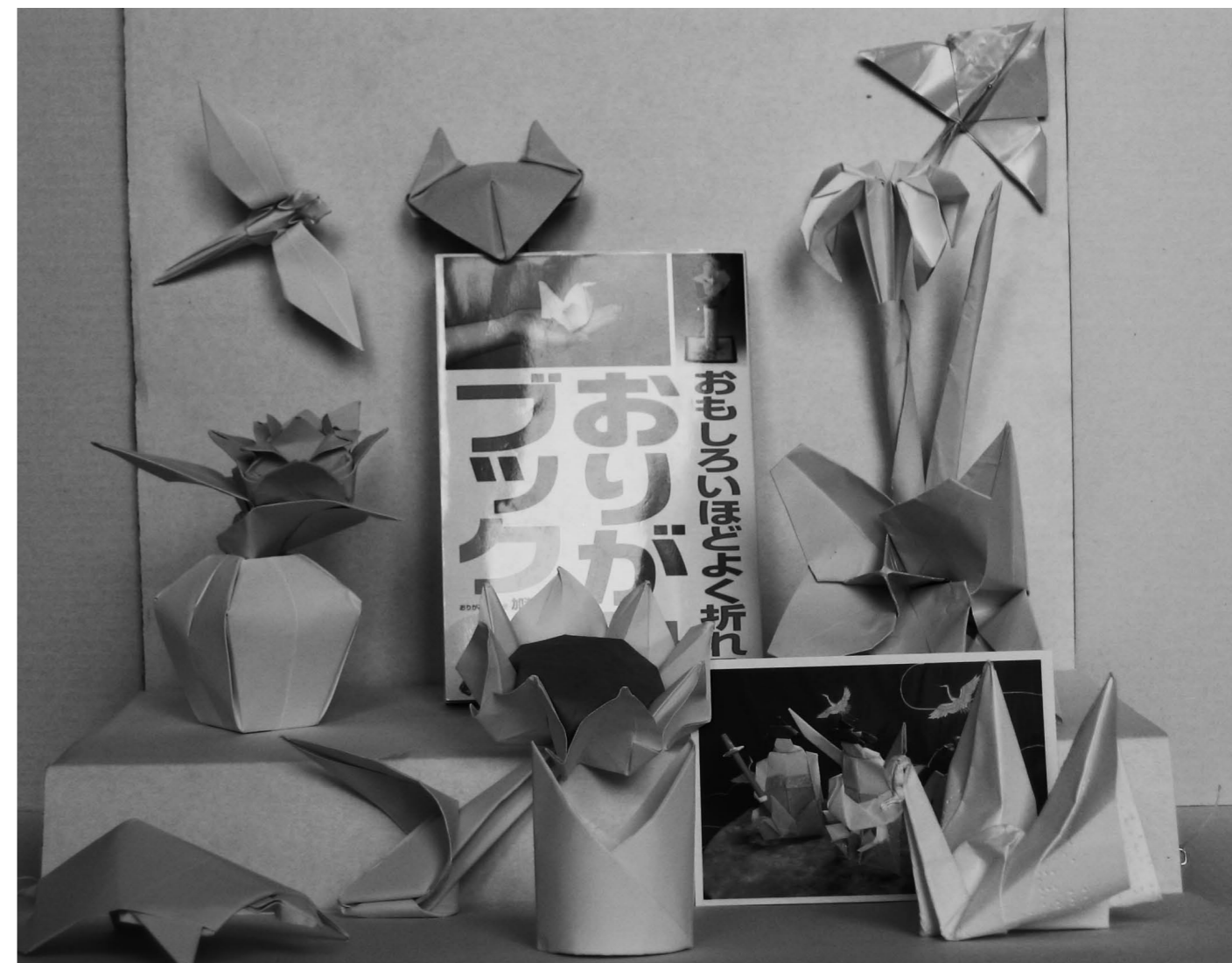
▲ Quelques pliages tirés du livre de S. Kase, livre que l'on voit en arrière-plan.

- Une autre est maintenant régulièrement sollicitée pour réaliser les éléments de décor de tables de fêtes. Son record est aujourd'hui