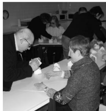
Un atelier origami en pleine activité

- Mise sur pied de séquences d'apprentissage correspondant aussi bien à une sensibilisation en quelques heures qu'à un véri-